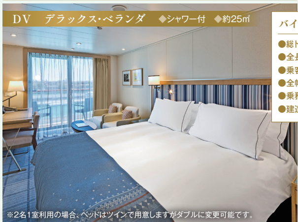
※2名1室利用の場合、ベッドはツインで用意しますがダブルに変更可能です。