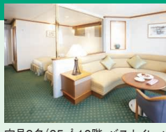
スイート A(1005~1018) B(1019 1020) 定員2名 (35㎡ 10階、バス・トイレ・バルコニー付) ※ブルーレイプレーヤー付 ※スイートBは、救命ボートによりベランダの眺望が妨げられます。