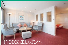
(1003) エレガント 定員2名 (65㎡ 10階、展望バス・トイレ・バルコニー付) ※ブルーレイプレーヤー、インターネット閲覧専用ノートパソコン付