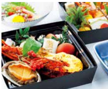
おせち料理(イメージ)

年越しは、お客様とエンターテイナー、にっぽん丸スタッフみんなでカウントダウン。新年を迎えたら次は鏡開き、元日にはおせち料理をご用意します。海外にいらながらも、日本らしいお正月をお過ごしいただけます。