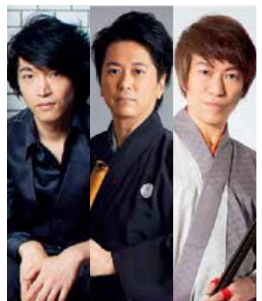
ザ・パンプキンズ

欧州の名門歌劇場に主要キャストで出演し、全国各地でのリサイタルや、テレビ、ラジオでも活躍。第3代クルーズ・アンバサダー。二期会会員。