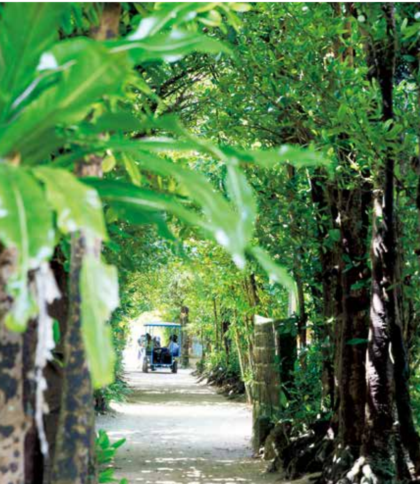
本部 備瀬のフクギ並木と水牛車