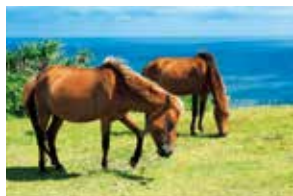
与那国島 与那国馬