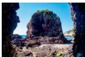
粟国島 東ヤマトウガ

日本最西端の国境の島。断崖絶壁に囲まれた孤島で、与那国馬など多様な生物が生息し、海の下に海底遺跡が眠っています。