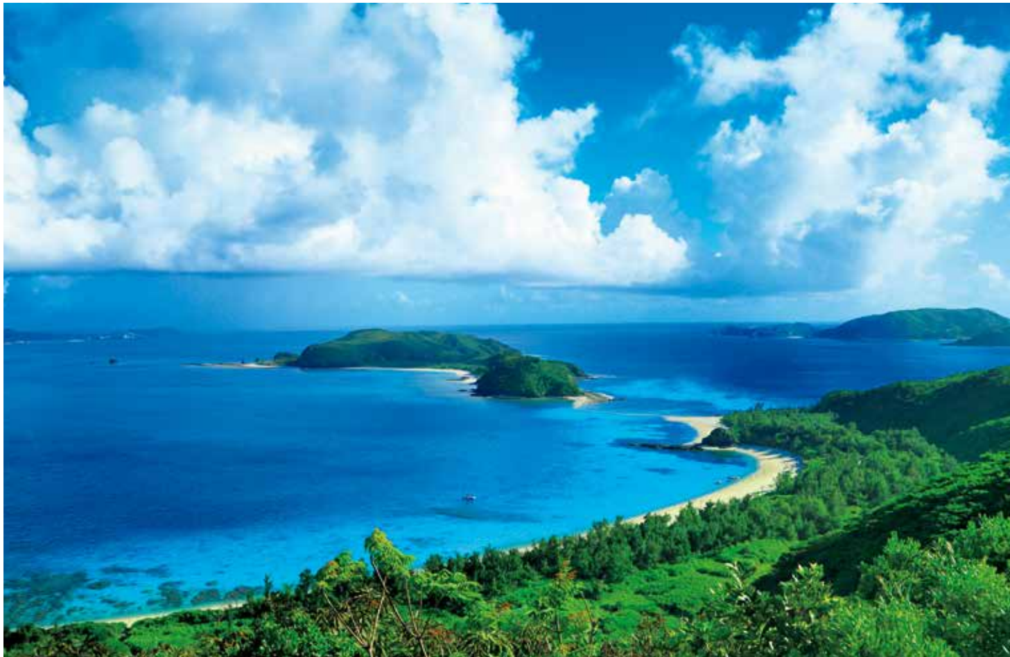
座間味島 古座間味ビーチと安室島

すべてのコースで「っぽん丸」おすすめの沖縄のスイーツやドリンクを船上でお出しする「っぽん丸 美ら海カフェ」をオープンします。 Bコースでは、本島北部に停泊し、沖縄美ら海水族館での貸切ディナーや、やんばるを満喫する寄港地観光ツアーなどを追加料金なし・定員制でご用意します。