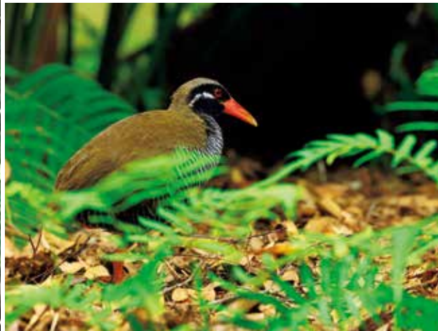
上：ハイビスカス(イメージ)/下：ヤンバルクイナ(イメージ)