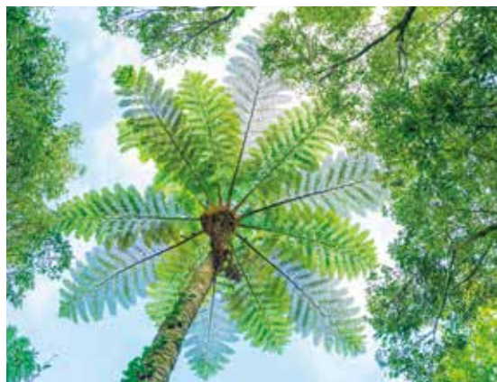
金作原原生林 ヒカゲヘゴ(イメージ)