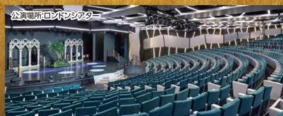
公演場所ロンドンシアター