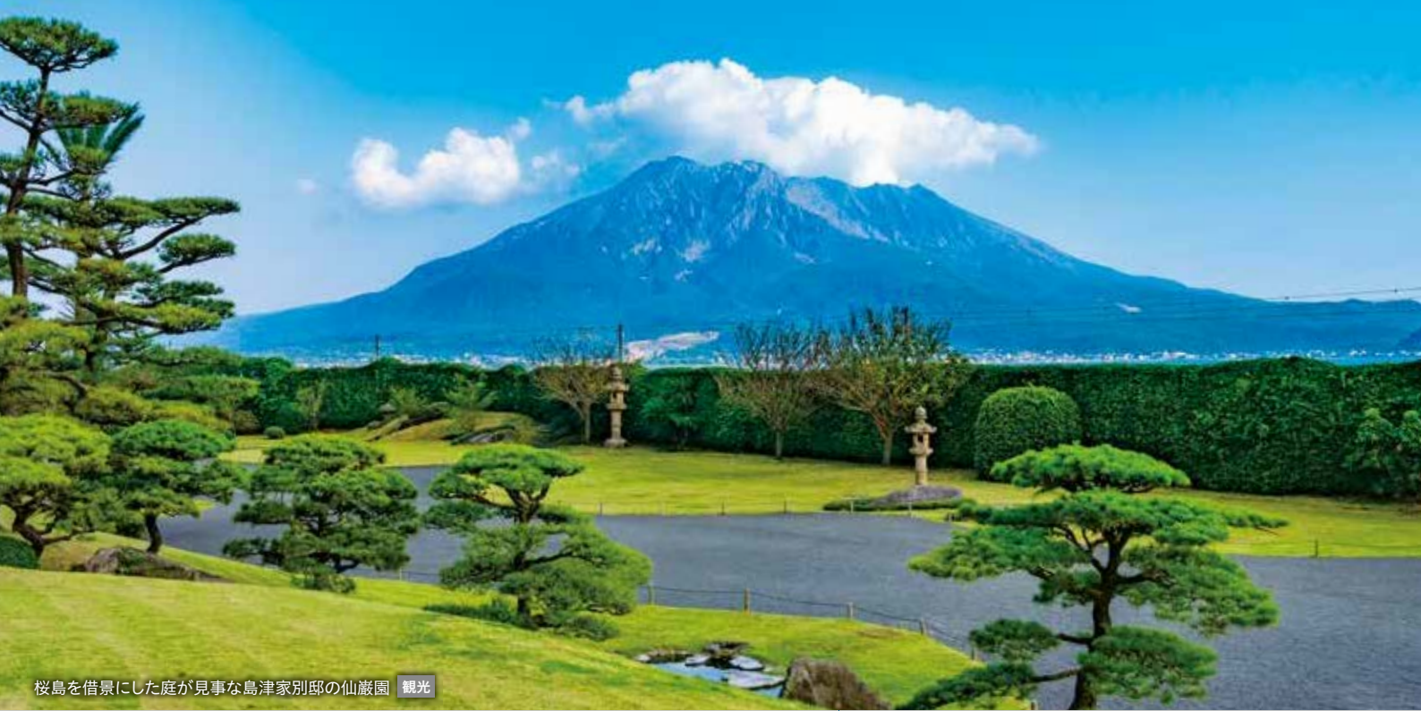
桜島を借景にした庭が見事な島津家別邸の仙巖園 観光