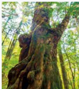
屋久杉が息づく太古の森へ 観光