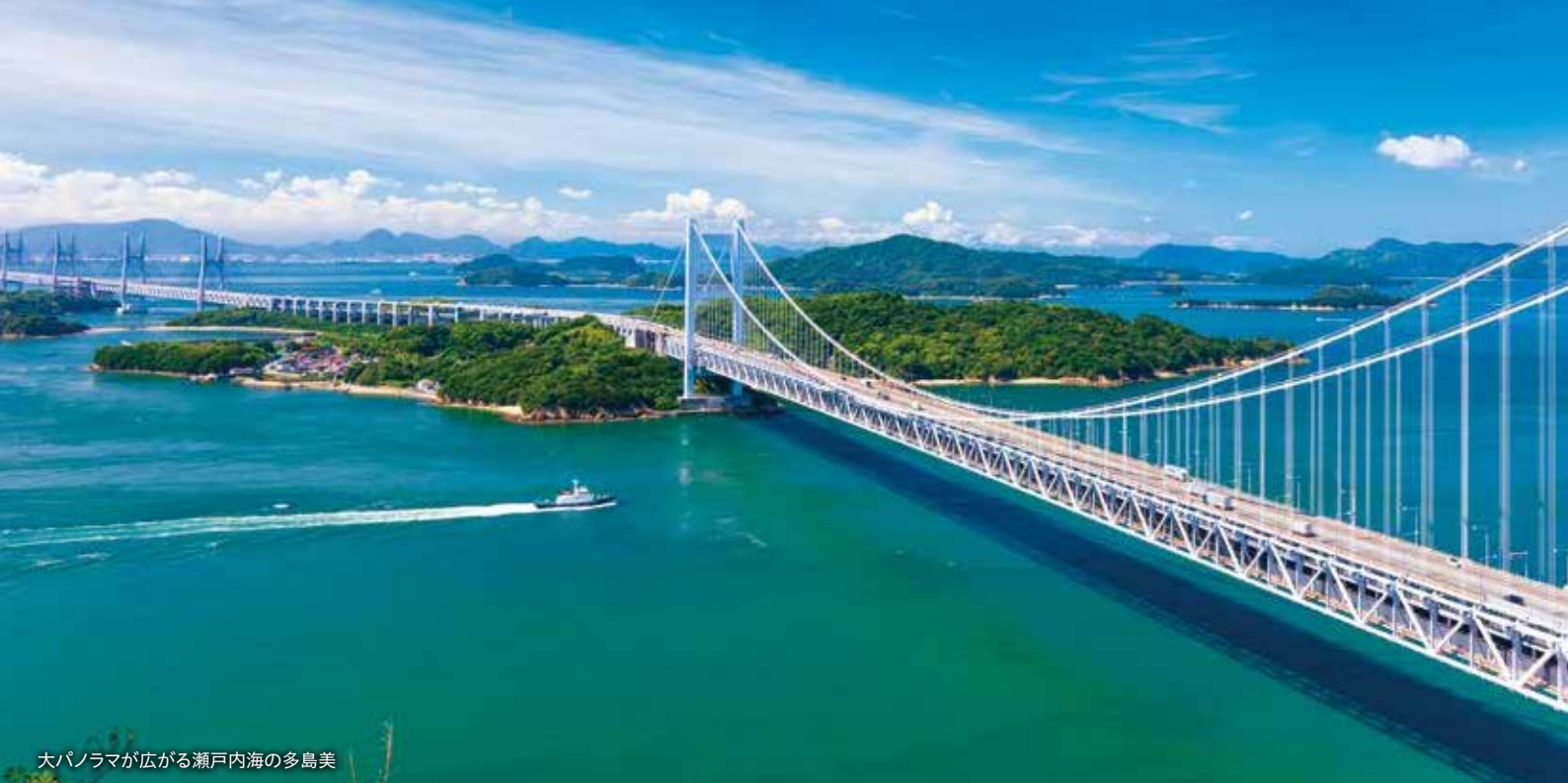
大パノラマが広がる瀬戸内海の多島美

※掲載の写真は陸から見た瀬戸大橋のイメージです。実際には「飛鳥Ⅲ」船上からご覧いただけます。