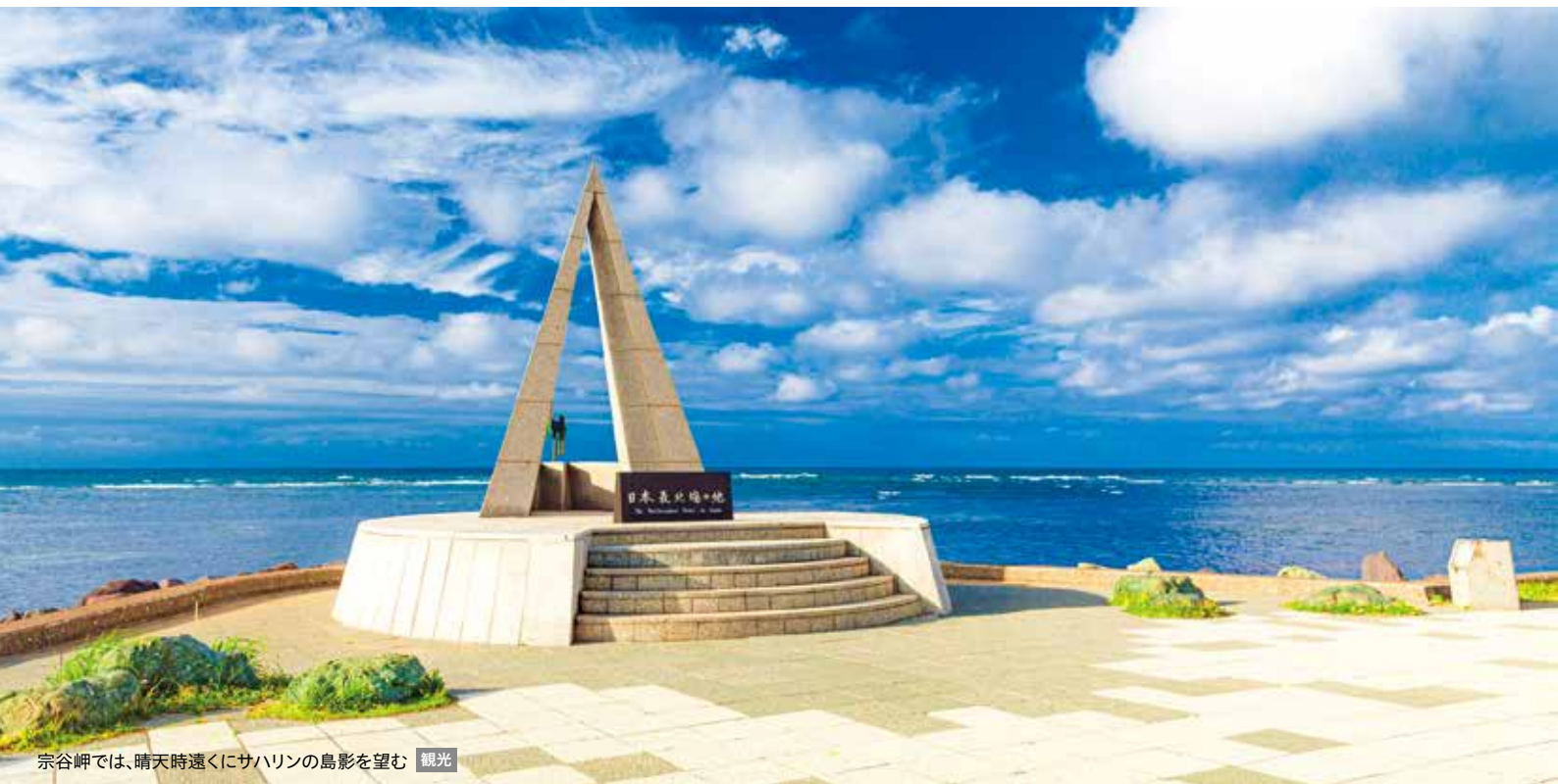
宗谷岬では、晴天時遠くにサハリンの島影を望む 観光

網走からは世界遺産・知床、稚内からは雄大な利尻富士がそびえる利尻島・礼文島へ足を延ばすことも。北海道屈指の見どころを悠々とめぐります。洋上で過ごす豊かな時間に心が癒されます。