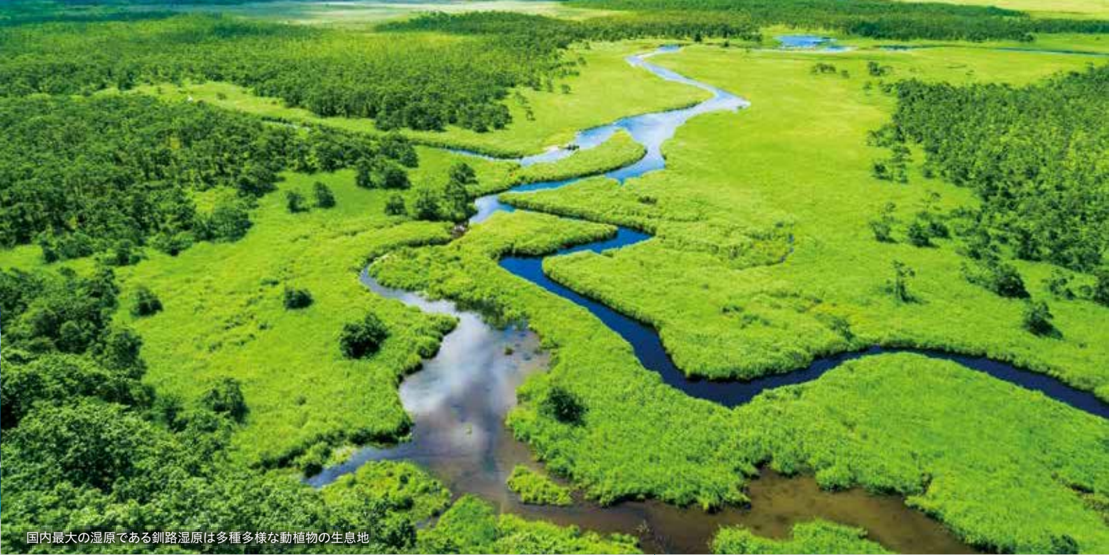
国内最大の湿原である釧路湿原は多種多様な動植物の生息地