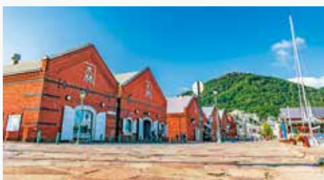
金森レンガ倉庫など函館は街歩きもおすすめ