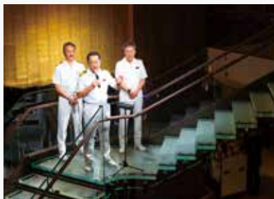
「飛鳥Ⅲ」就航1周年のお祝いもイメージ