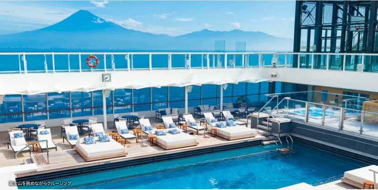
富士山を眺めながらクルージング

「飛鳥Ⅲ」就航1周年を記念したクルーズは、海の日を含む3連休を利用した4日間の旅。洋上から仰ぎ見る富士の雄姿が圧巻の清水寄港、船内では記念イベントやアニバーサリーメニューなど、楽しみ満載の記念日を。