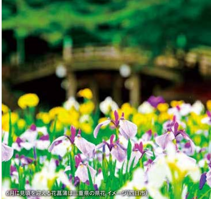
6月に見頃を迎える花菖蒲は三重県の県花 イメージ(四日市)

乗船地と下船地が異なる移動型クルーズなら、クルーズの前後に旅の自由度が広がります。名所めぐりや街並み散策をしたり、グルメを楽しんだり。自分好みに旅をアレンジして、より思い出に残るひとときを。