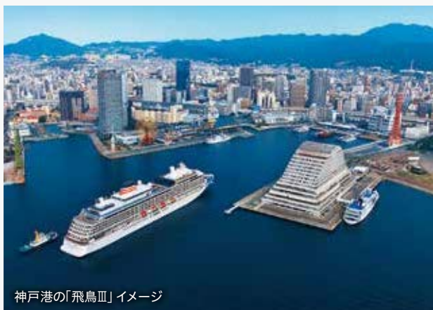
神戸港の「飛鳥III」イメージ