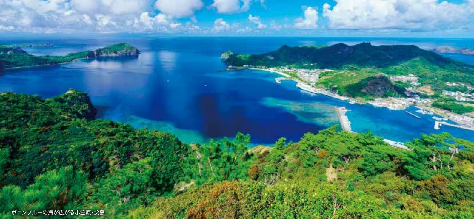
ボニンブルーの海が広がる小笠原・父島