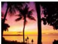
グアムの美しい夕日

■旅券・査証について(※裏表紙 旅行条件もご覧ください) 有効期限が2026年8月6日以降の旅券(パスポート)が必要です。 ESTA(米国電子渡航認証システム)による認証取得または査証(ビザ)が必要です。 査証(ビザ)は米国査証免除プログラムの非適格条項に該当する場合に必要です。詳細は販売店にお問い合わせください。 ※18歳未満の未成年が片親同伴または単独で参加する場合、両親からの英文同意書が必要になります(2025年7月現在)。