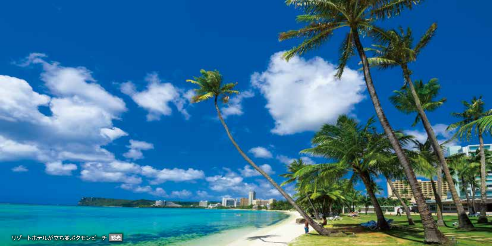
リゾートホテルが立ち並ぶタモンビーチ 観光