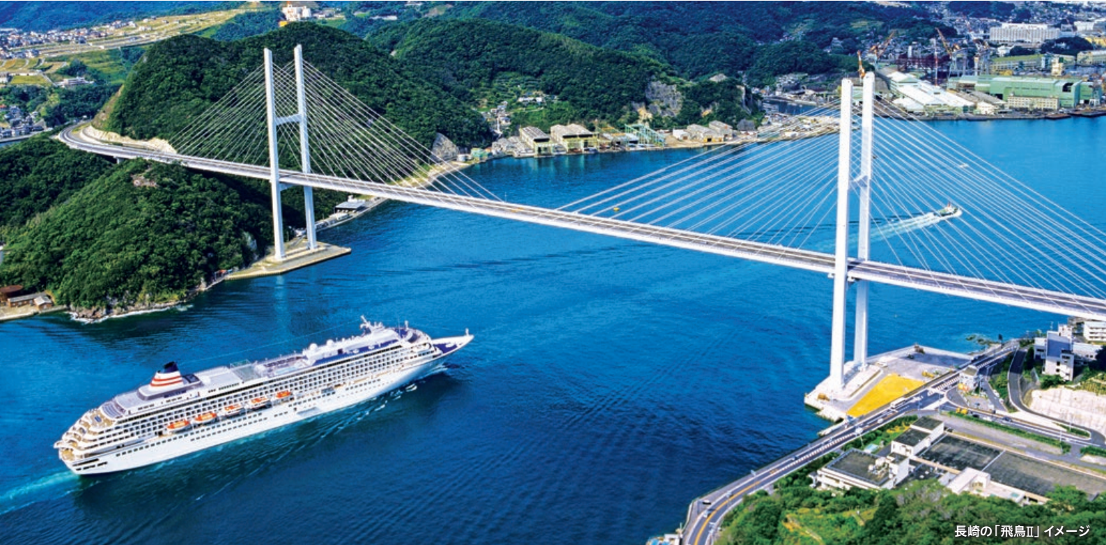
長崎の「飛鳥II」イメージ