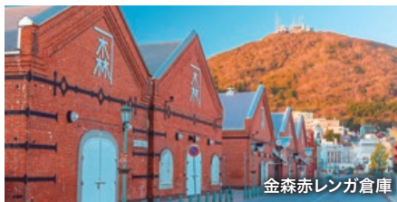
金森赤レンガ倉庫