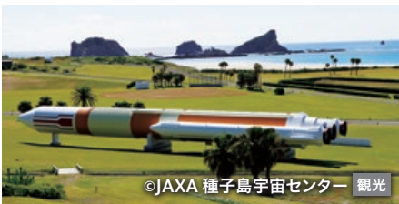
種子島宇宙センター 観光