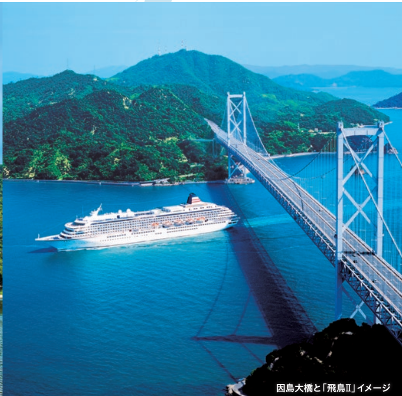
因島大橋と「飛鳥II」イメージ