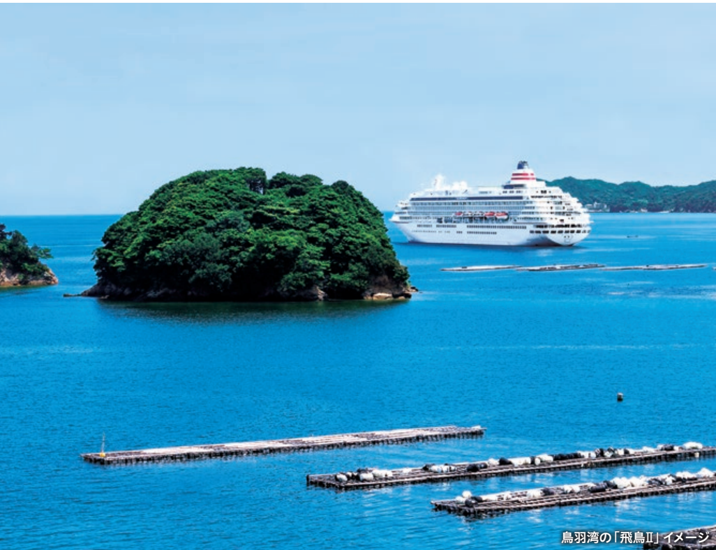
鳥羽湾の「飛鳥II」イメージ