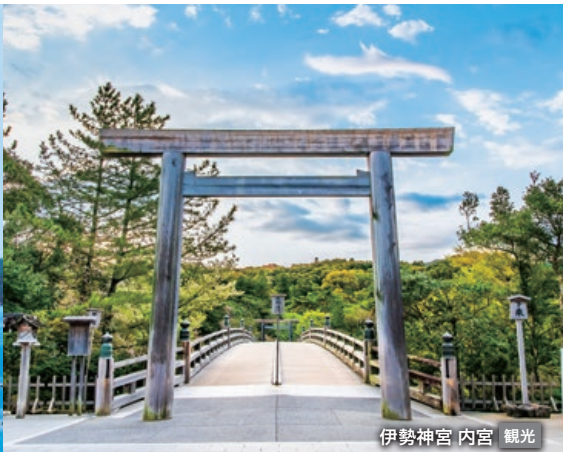
伊勢神宮 内宮 観光