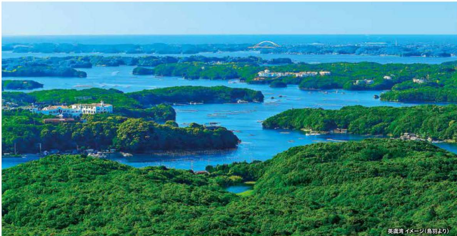
英虞湾 イメージ(鳥羽より)