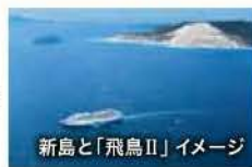
新島と「飛鳥II」イメージ

個性豊かな自然が魅力の伊豆諸島の景観を、デッキからご覧ください。 ※伊豆諸島の島への寄港はございません。